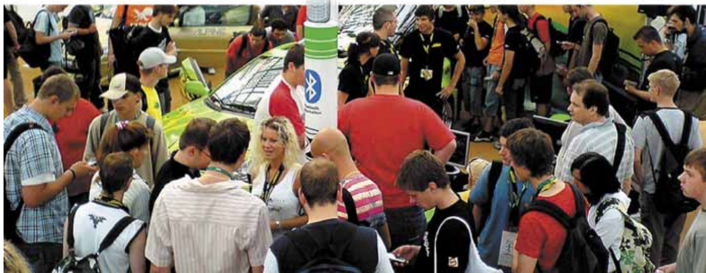
Эффект «горшка с мёдом» на выставке

Ведущие компании мира уже осознали эффективность подобной технологии и активно используют её для усиления своих позиций на рынке.