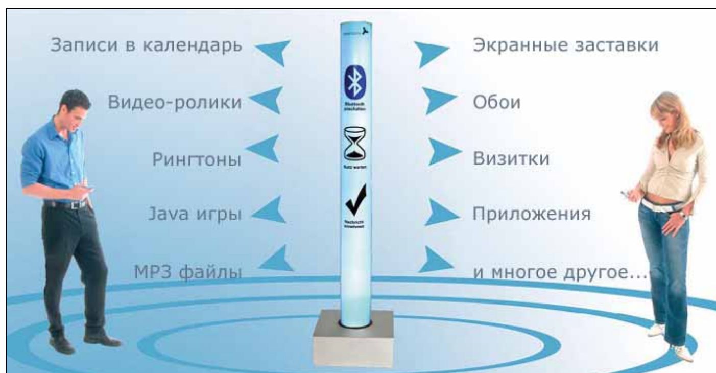
Возможный контент для рассылки