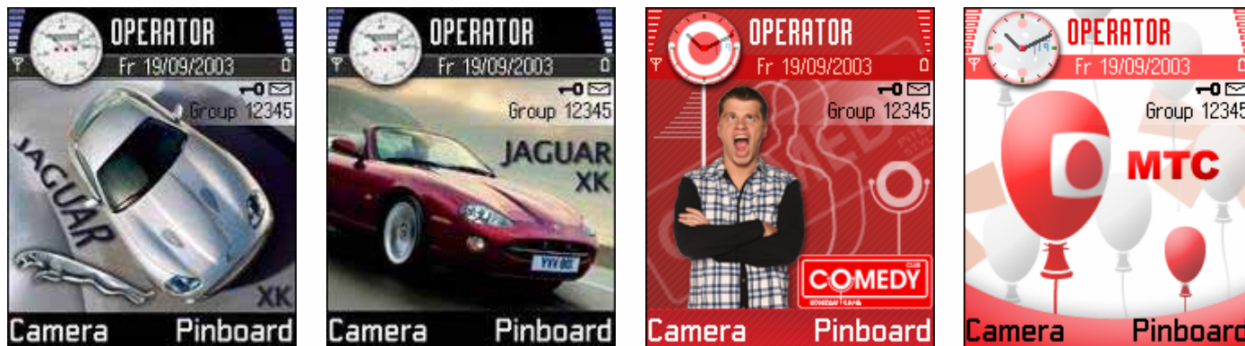
Примеры брендированных тем для клиентов

Узнаваемость бренда может достигнуть новых высот при использовании инновационных промо-материалов для мобильных телефонов (таких как: видеоклипы, рингтоны, экранные заставки, брендированные темы и Java игры). Подобные материалы, как правило, быстро распространяются в кругу друзей среди молодёжи путём повторной передачи с телефона на телефон.