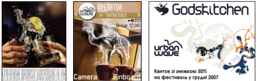
Образцы разосланного контента